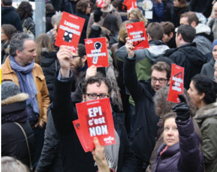
Manifestation le 26 janvier 2016 à Bordeaux

Comment 7100 collèves en France dont 105 en Gironde qui fonctionnent de façon individuelle pourraient-ils donner un sens, une culture et des valeurs communs ?