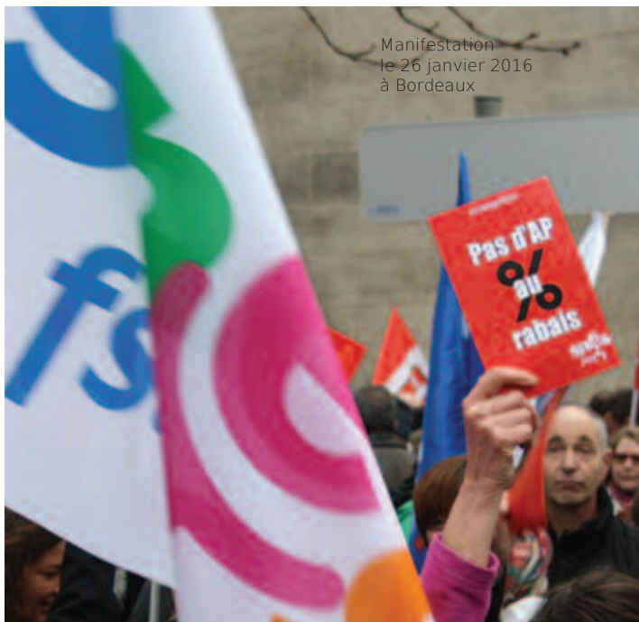
Manifestation le 26 janvier 2016 à Bordeaux

D'autres IPR se sont montrées plus autoritaires, voire franchement désagréables et cassantes, dès lors que l'on cherchait à poser des questions, comme si un manque d'autorité en la matière pouvait être en quelque sorte « rattrapé » par un excès d'autoritarisme malvenu. La « bienveillance » n'est décidément pas pour nous si l'on questionne la mise en place d'une réforme basée sur des considérations matérielles et pédagogiques assénées comme autant de vérités sans étayage scientifique, sans partir des besoins du terrain, faisant fi des considérations des professionnels qui connaissent le terrain et de celles de chercheurs, universitaires et spécialistes de la pédagogie, des syndicats d'enseignants et même d'inspecteurs - c'est